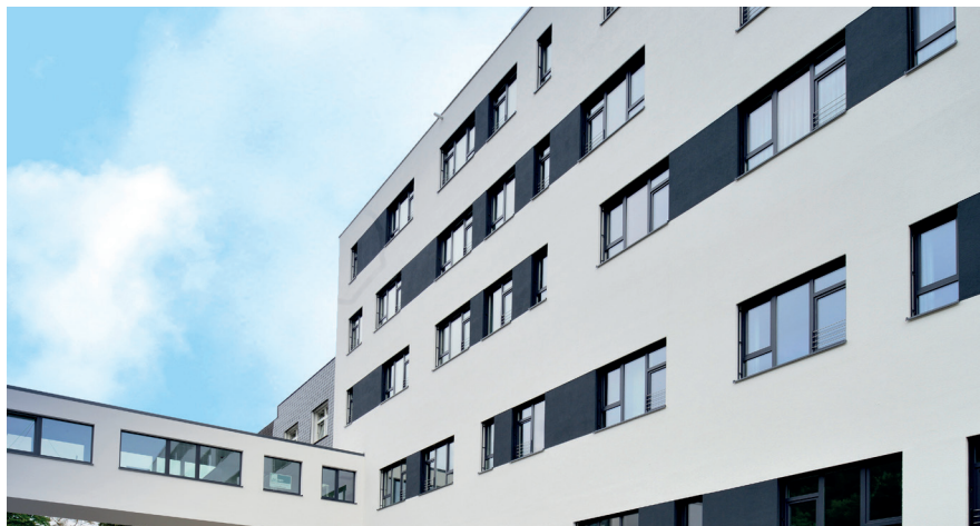
Das Kreisklinikum in Siegen setzt auf Wirtschaftlichkeit und Qualität durch Mitgliedschaft in der AGKAMED GmbH, dem Kompetenzpartner für Krankenhäuser in den Bereichen Einkauf, Logistik und Prozessoptimierung.

Das Kreisklinikum Siegen entschied sich, für die Klinik, das angeschlossene Ärztehaus sowie für die angegliederte Krankenpflegeschule und Kita die Unterhalts-, Glas- und OP-Reinigung sowie die Hol- und Bringendienste und die Spülküche neu auszuschreiben. Die wichtigste Zielsetzung der Ausschreibung war die Umsetzung einer sehr hohen Qualität mit einem realistischen Preis-/Leistungsverhältnis.